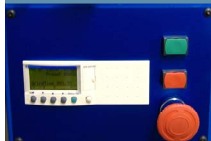
Übersichtliche Bedieneinheit, einfachste Handhabung